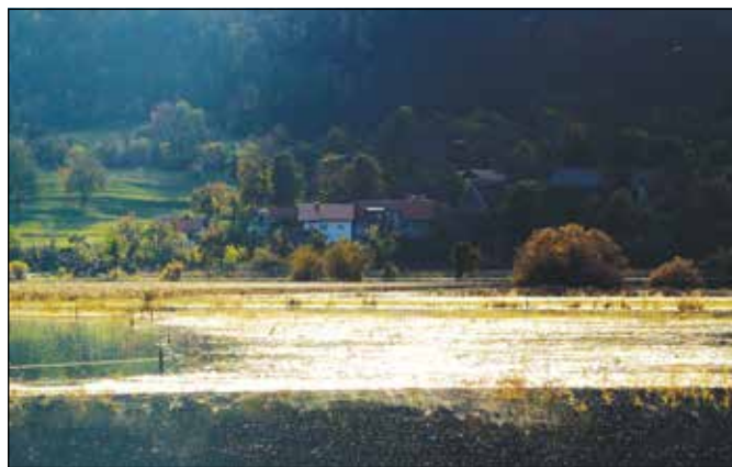
Laze v oktobrski svetlobi