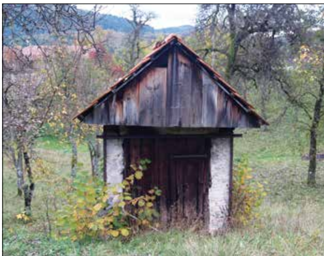
»Pajštaba« v sadovnjaku

Laze obiskovalcu lahko ponudijo marsikaj zanimivega. Ena izmed takšnih znamenitosti je tudi »pajštaba«, sušilnica za sadje. Včasih so jih imele vse hiše na Lazah. Zaradi požarne varnosti so bile postavljene stran od poslopij, na samo. Dobro ohranjena je samo »pajštaba«, zidana iz kamna, nastala v zadnji četrtini 19. stoletja, ki stoji v sadovnjaku Franceta Kotnika.