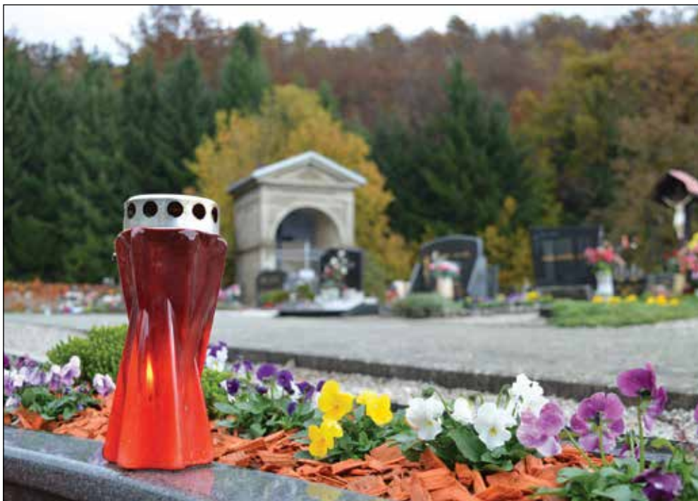
Na komunalni opažajo, da ljudje prižgejo manj sveč kot so jih pred leti.

Glede na to, da se je zaradi izgradnje novih stanovanjskih sosesk v zadnjih letih v naše kraje preselilo precejšnje število novih prebivalcev, nas je zanimalo, ali morda v prihodnje razmišljajo o širitvi nekaterih pokopališč. Na komunalni odgovarjajo, da zaenkrat te potrebe še ni, se pa kot rešitev za morebitno primanjkovanje prostora na številnih